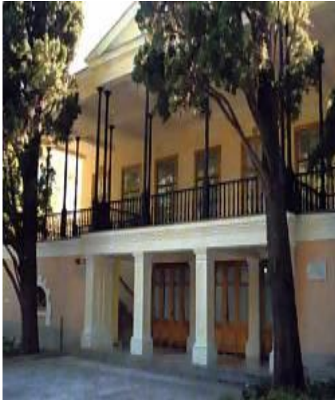
Гурзуф и Феодосия

4 сентября 1826 года Николай 1 неожиданно вызвал Пушкина в Москву. Но свобода, предоставленная царем, была недолгой. Уже в 1828 году вышло постановление Государственного совета о надзоре над Пушкиным. В этом же году он самовольно уехал на Кавказ, где служили его друзья.