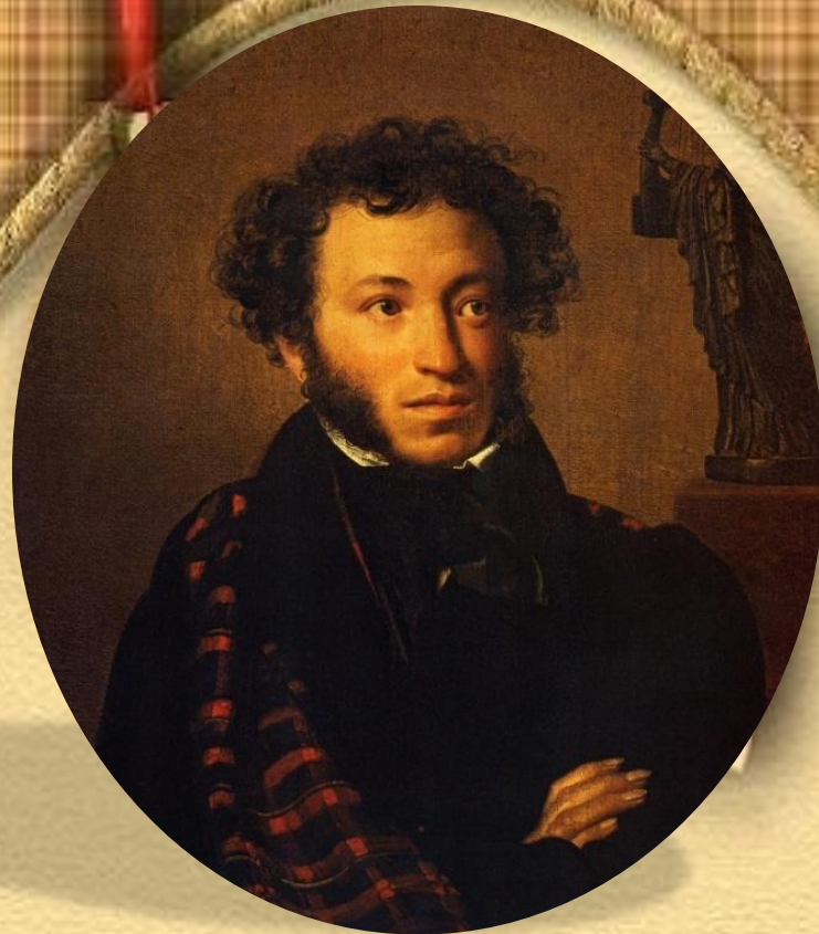
А. С. Пушкин . «Капитанская дочка»