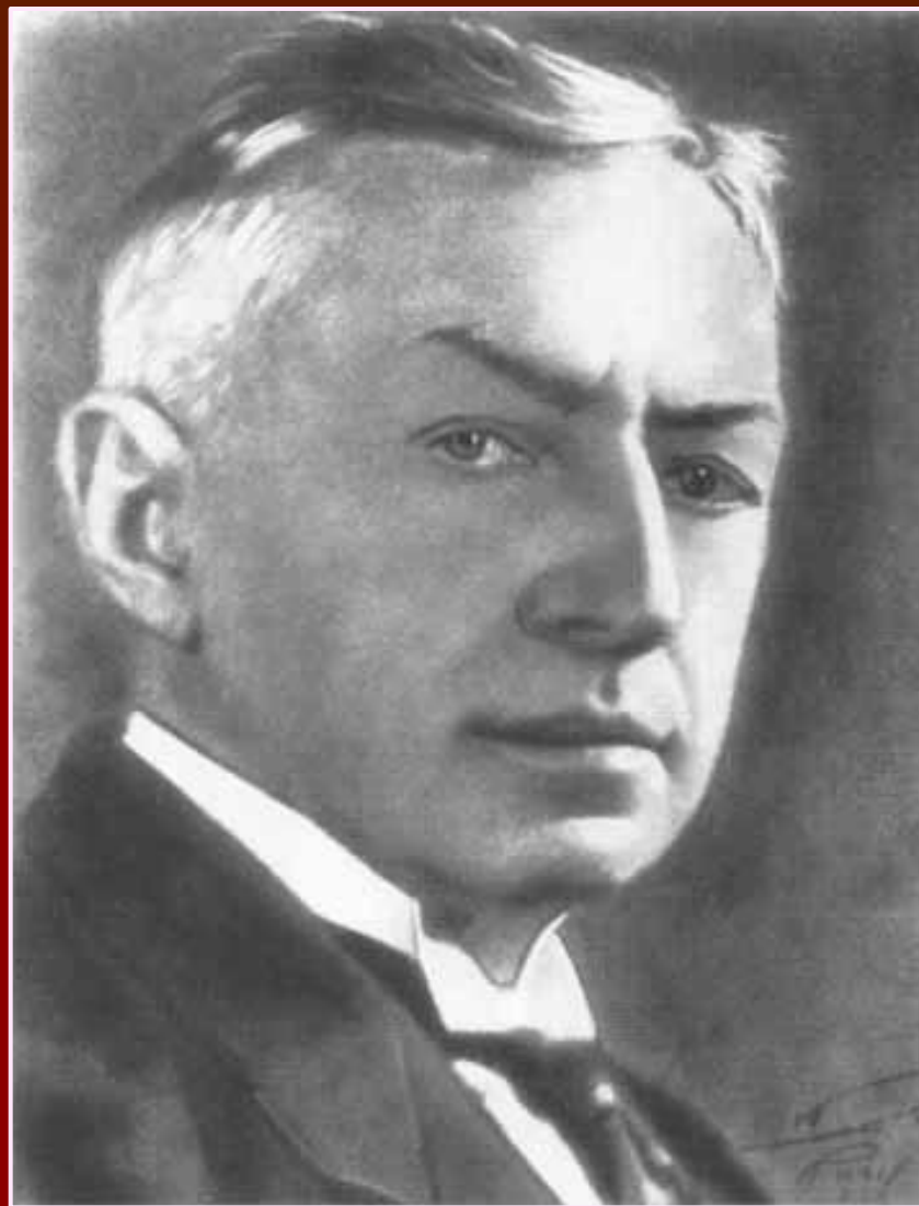
Бунин Иван Алексеевич (1870-1953)