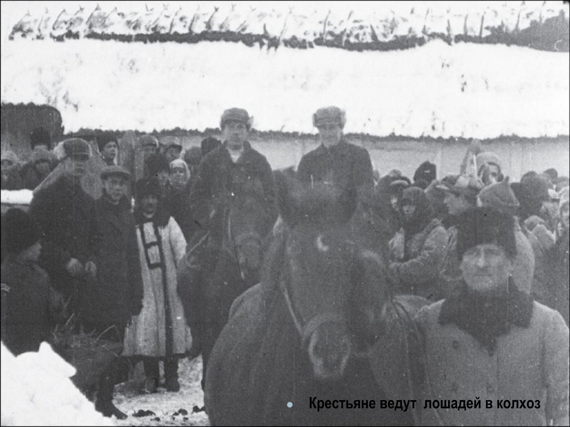
• Крестьяне ведут лошадей в колхоз