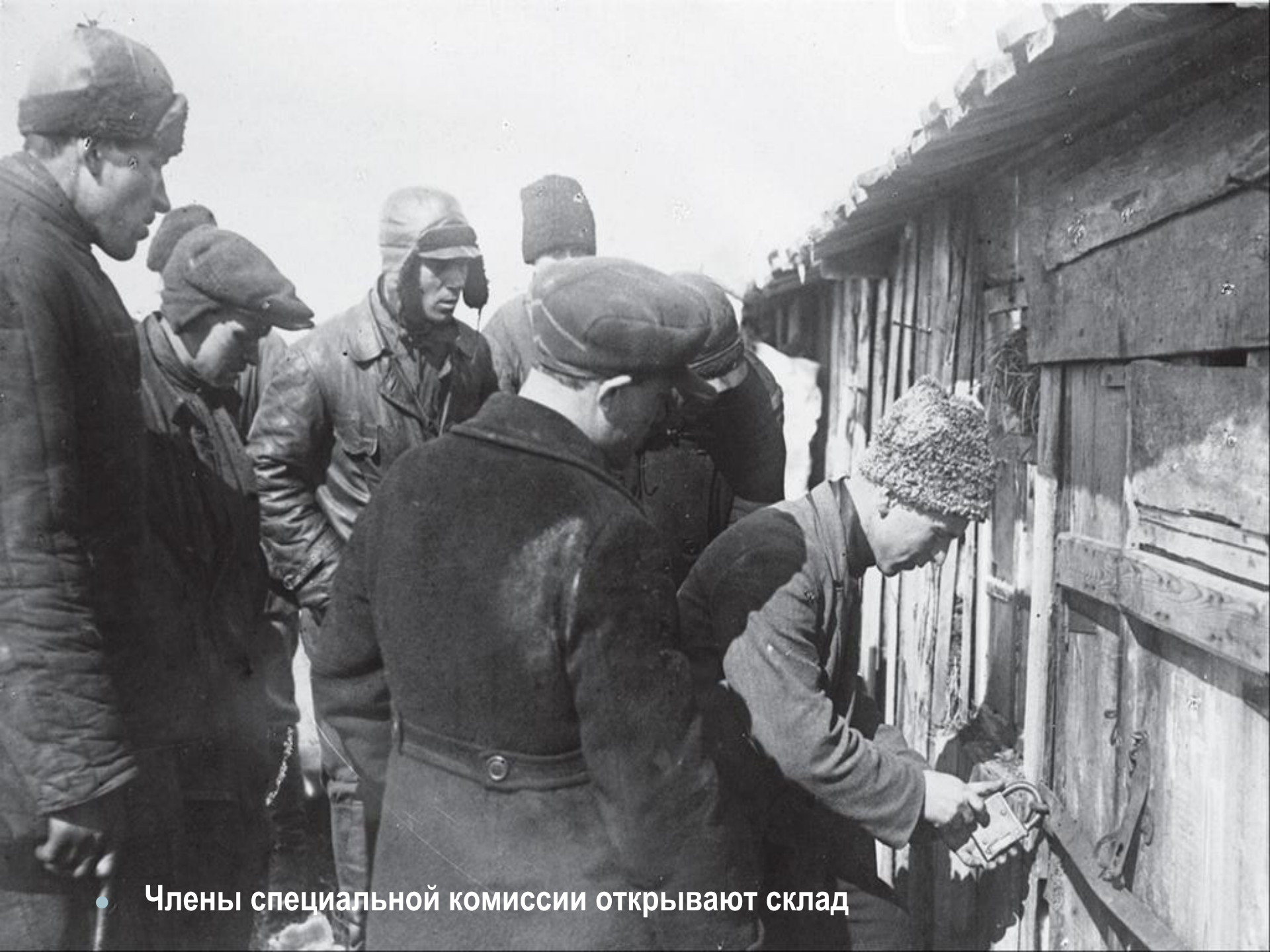
• Члены специальной комиссии открывают склад