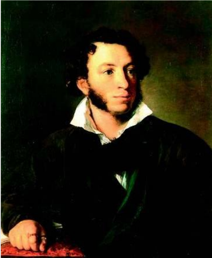
Александр Сергеевич Пушкин Художник В.А.Тропинин