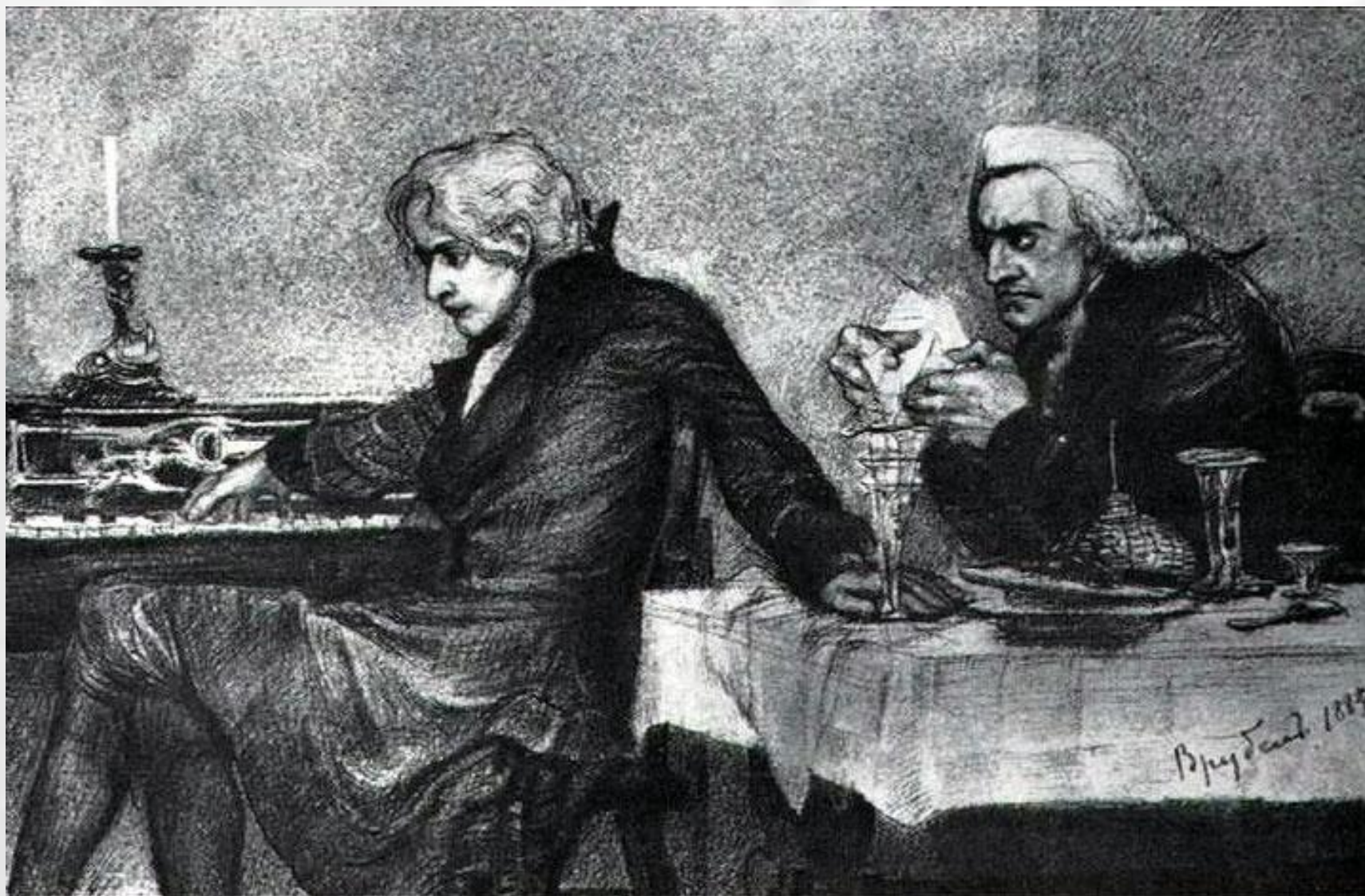
М.А.Врубель. Иллюстрация к трагедии «Моцарт и Сальери. Яд.