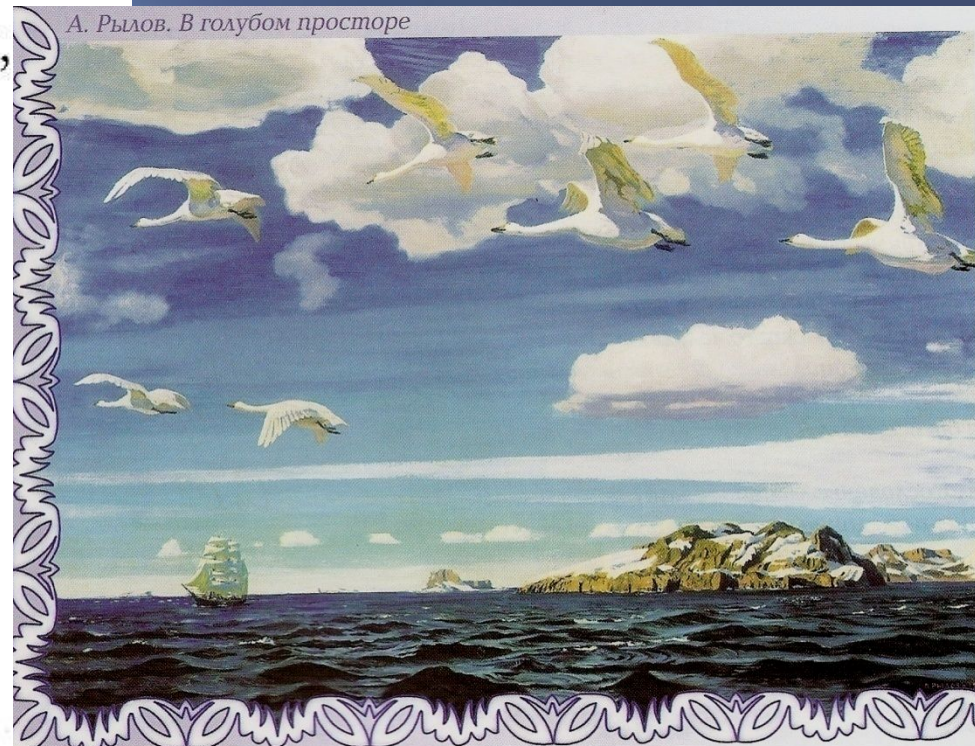
А. Рылов. В голубом просторе