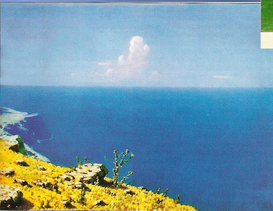
А.И.Куинджи. Море. Крым. 1898–1908

На сколько частей можно разделить стихотворение Лермонтова?