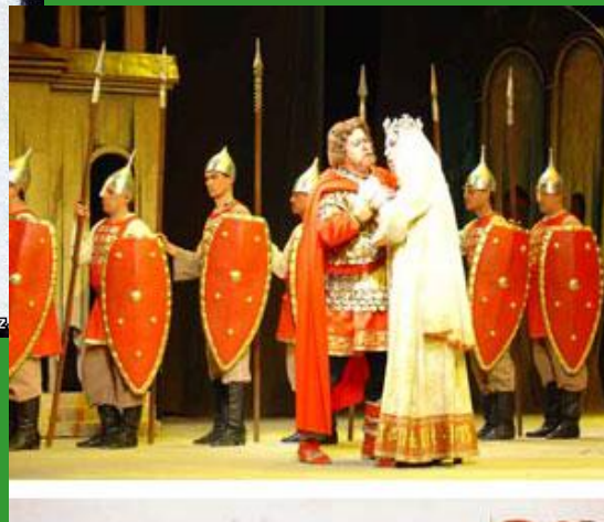
Опера «Князь Игорь»