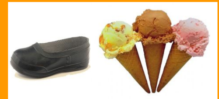
Калоши и мороженое