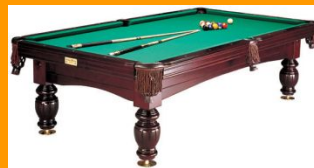
30 лет спустя