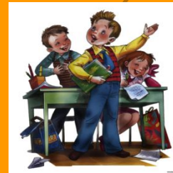
Не надо врать