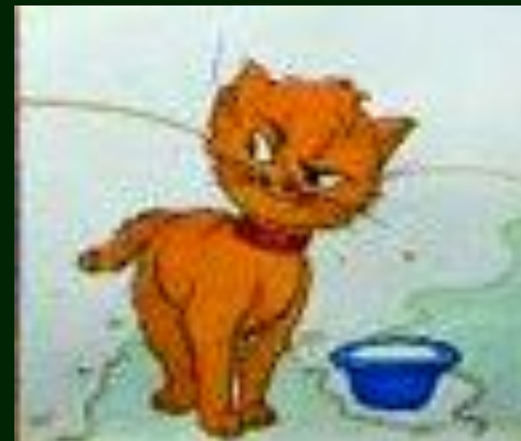
ХОЗЯИН И СТОРОЖ