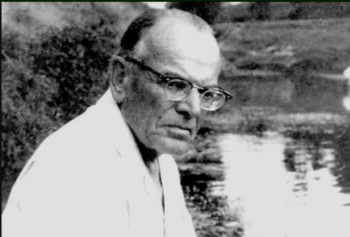
Паустовский Константин Георгиевич