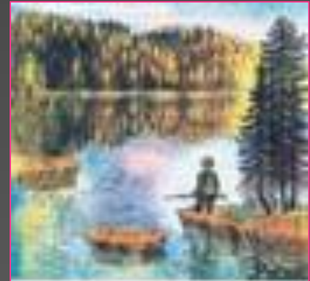
«Васюткино озеро». Худ. С.Сюхин. 1990