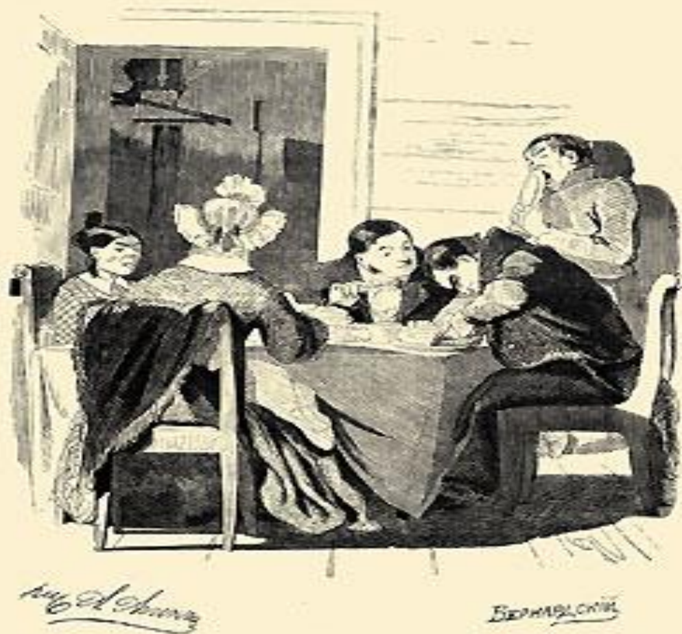
Собакевич за едой