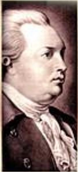
Д. И. Фонвизин Комедии

Автор негодует на порок И клеймит его без пощады.