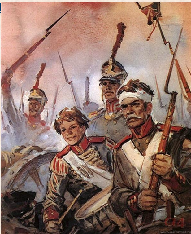
Герои Бородинской битвы

Афанасий Столыпин – брат бабушки поэта, участник войны 1812 года, артиллерист- «бородинец». Он когда-то живо и образно поведал М.Ю.Лермонтову о ходе великой битвы. Еще в юношеском стихотворении «Поле Бородина» Лермонтов выразил восхищение подвигом русских воинов. Многие мотивы этого произведения были позднее переосмыслены и вошли в окончательный вариант «Бород