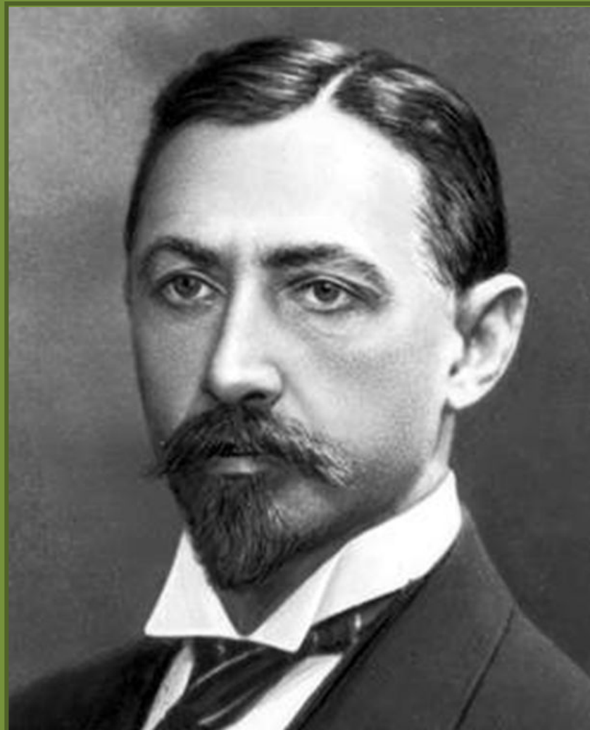
Иван Александрович БУНИН

«Литература», №06/2011 ИД "Первое сентября"