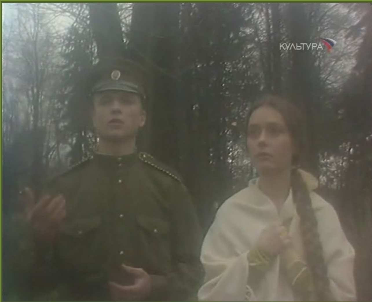
Кадр из фильма «Грамматика любви»

«Литература», №06/2011 ИД "Первое сентября"