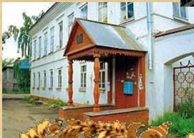
Старинный особняк, где мог жить Сквозник-Дмухановский