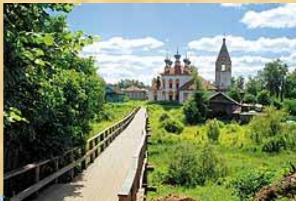
Почти центр города...

Ю.Манн, литературовед: «Сила «Ревизора» в том, что это особый город. Все нормы общежития, обращения людей друг к другу выглядят как повсеместные..Перед нами весь мир русской жизни, «вся Русь»