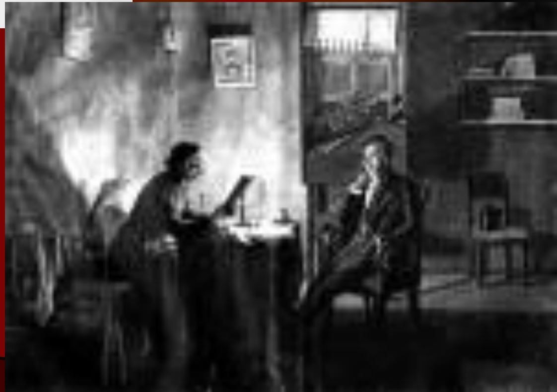
Пушкин у Гоголя