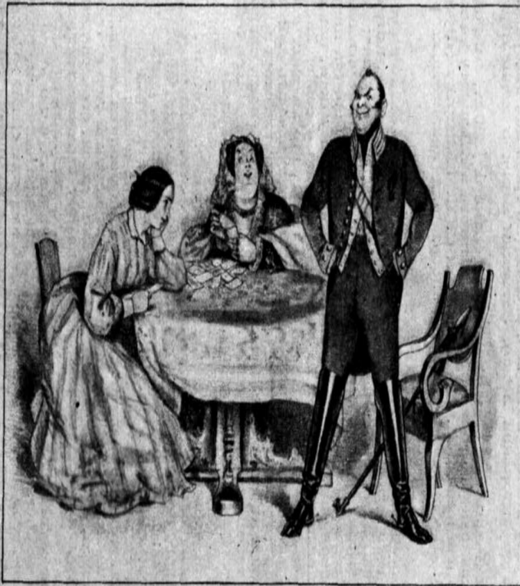
Рисунки: А. В. Никитенко.