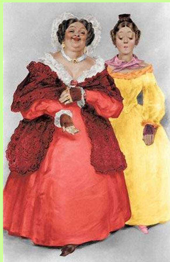
Бобчинский и Добчинский Жена и дочь Городничего