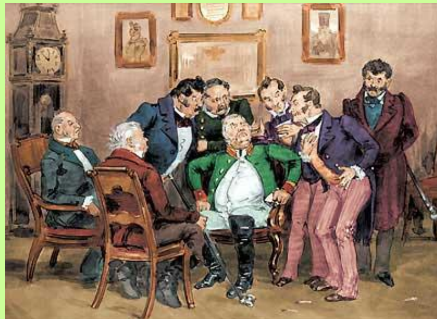
Чиновники обсуждают письмо Хлестакова