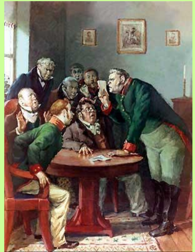
Действие I, явление 5-е.