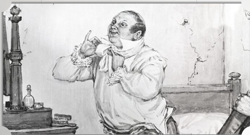
ПАВЕЛ ИВАНОВИЧ ЧИЧИКОВ В ГОСТИНИЦЕ ГУБЕРНСКОГО ГОРОДА.