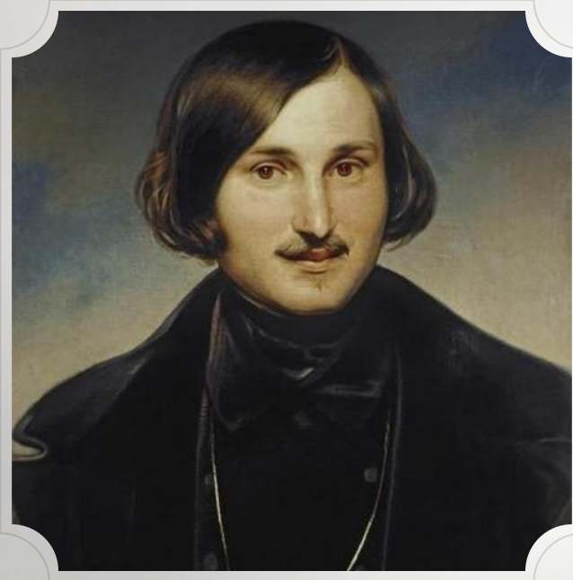
ПОРТРЕТ НИКОЛАЯ ГОГОЛЯ.