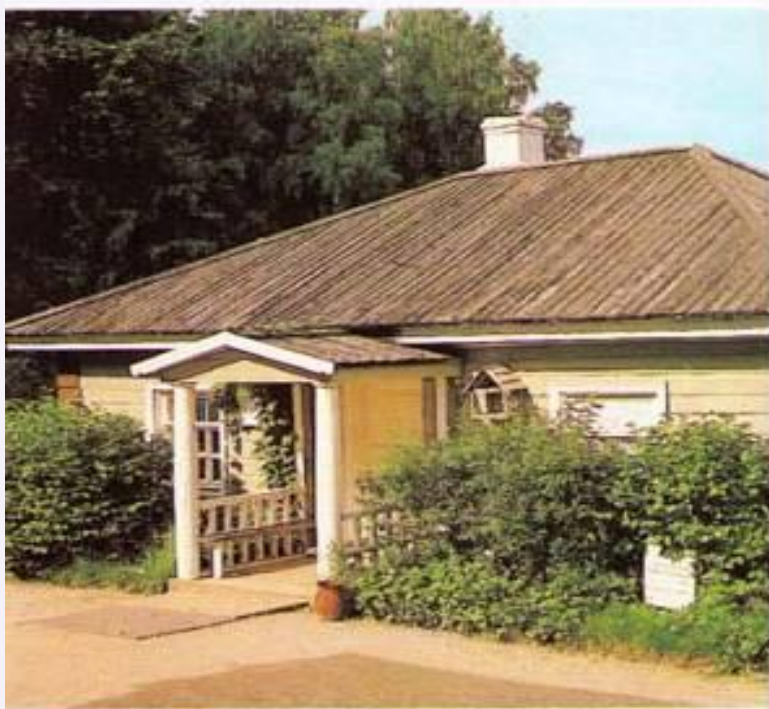
Домик няни А. С. Пушкина Арины Родионовны