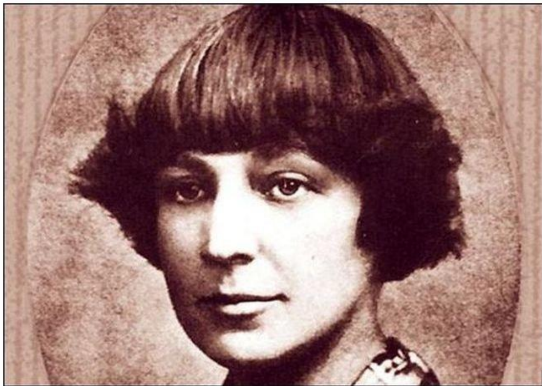
После начала Второй Мировой войны Марину Цветаеву отправили в эвакуацию в город Елабуга, что в Татарстане. Упаковывать вещи ей помогал Борис Пастернак. Он принёс верёвку, чтобы перевязать чемодан, и, заверяя в её крепости, пошутил: «Верёвка всё выдержит, хоть вешайся». Впоследствии ему передали, что именно на ней Цветаева в Елабуге и повесилась.

О значении этого стихотворения в жизни и творчестве Цветаевой лучше всех сказала сама поэтесса в 30-ые годы: «Формула – наперед – всей моей писательской и человеческой судьбы»