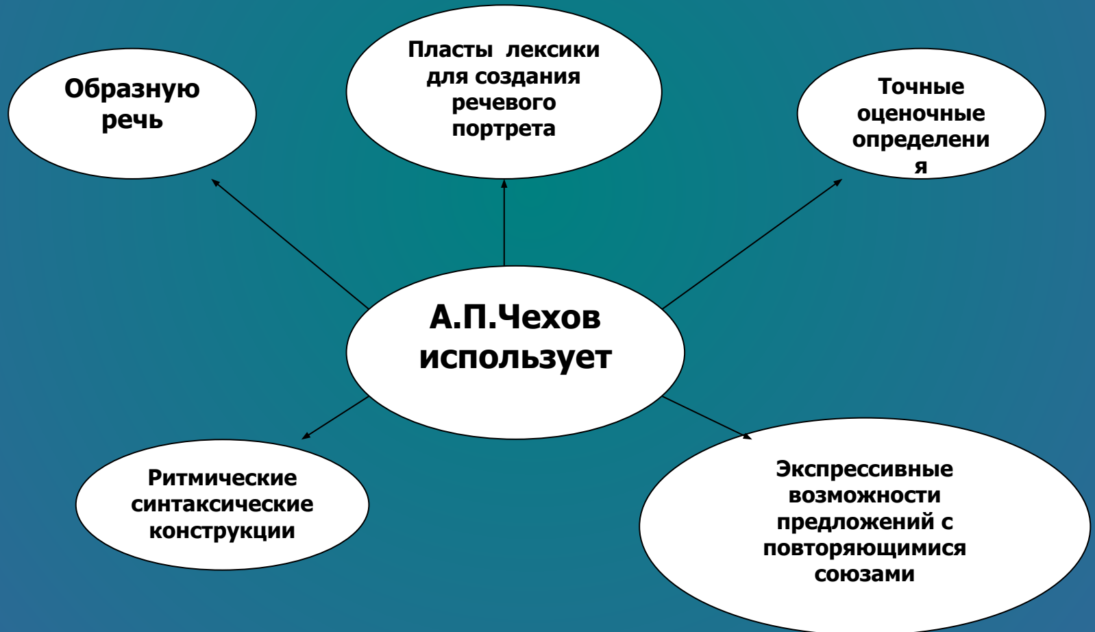
Схема-таблица « В творческой мастерской А. П.Чехова»: