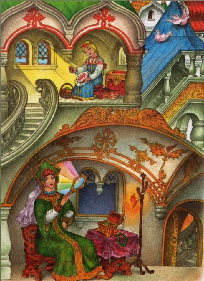
Иллюстрации Ст. Ковалёва