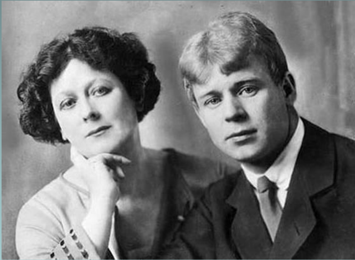
Сергей Есенин и Айседора Дункан 1923 г.