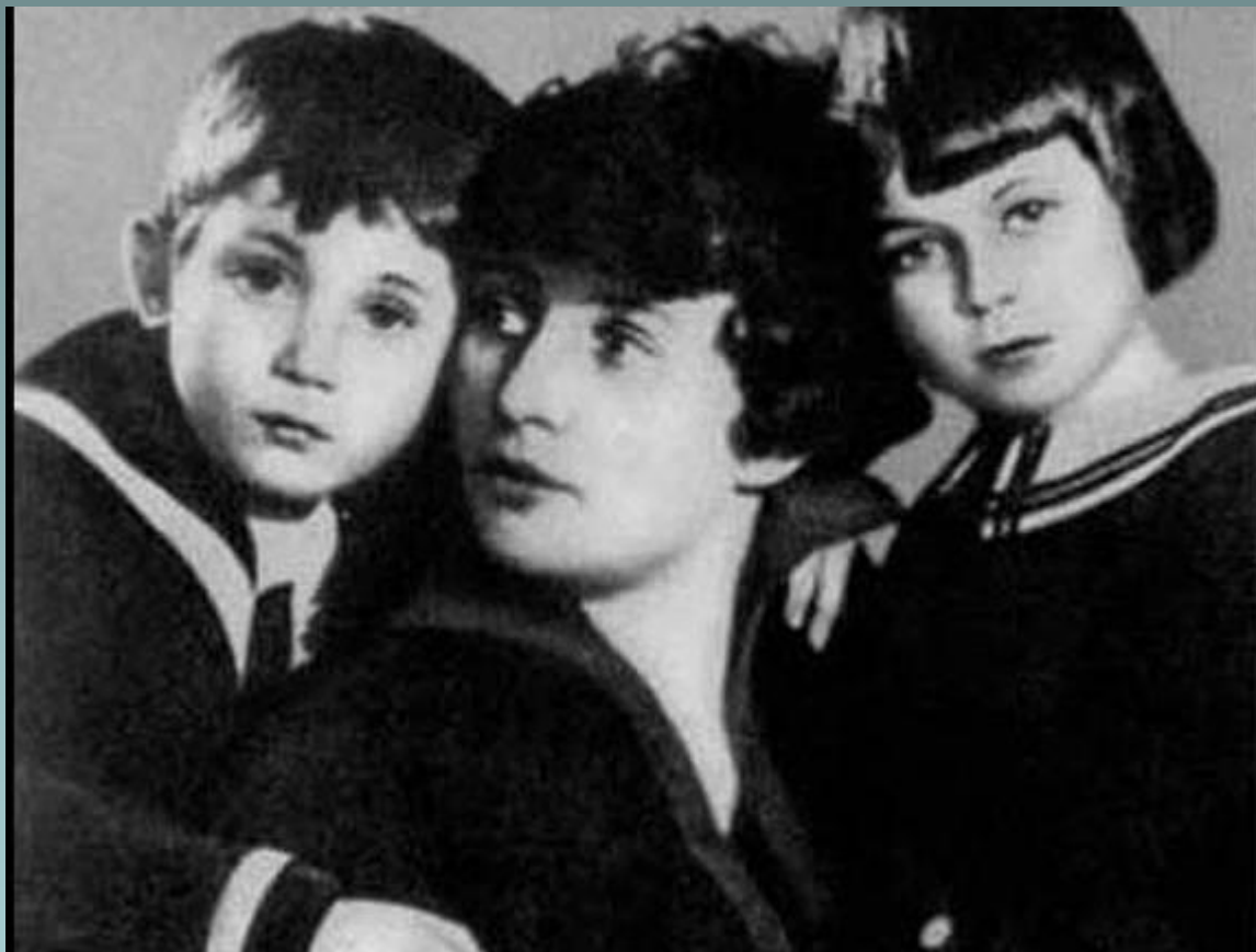
Зинаида Райх и дети Костя и Татьяна