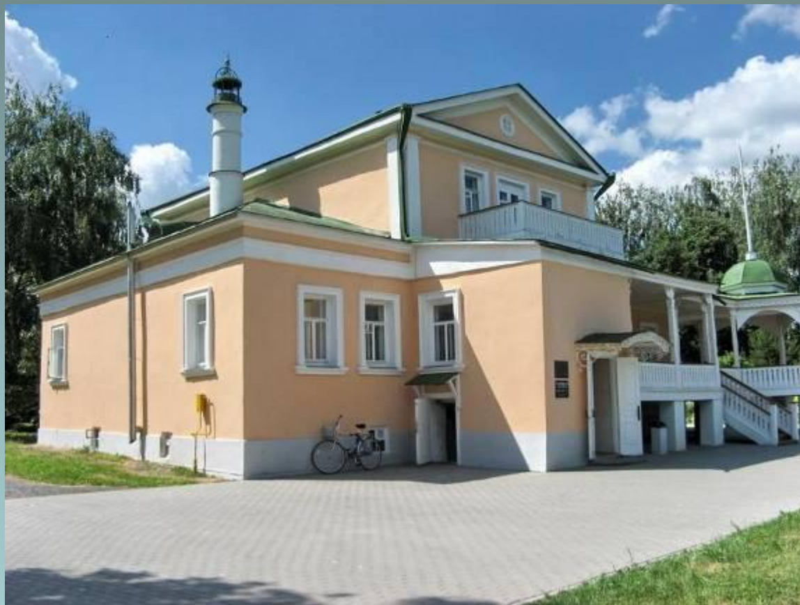
Музей Есенина в селе Константиново