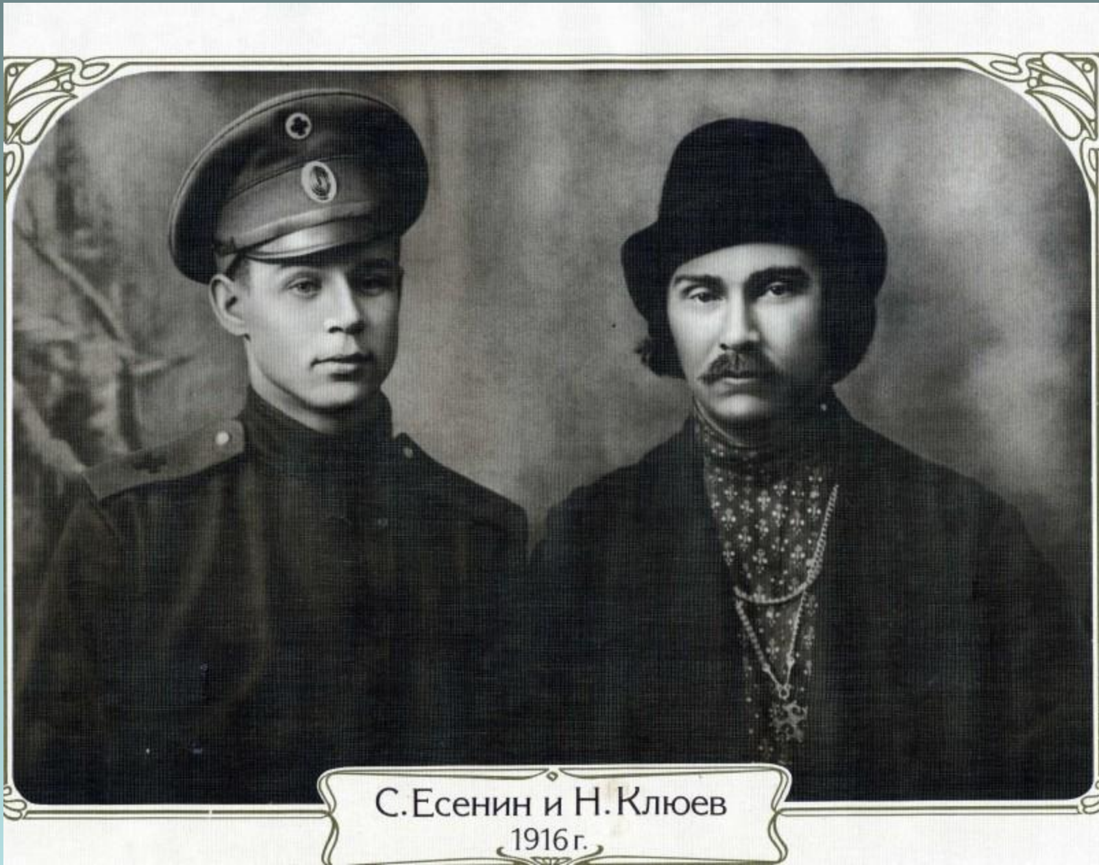
С.Есенин и Н.Клюев 1916г.