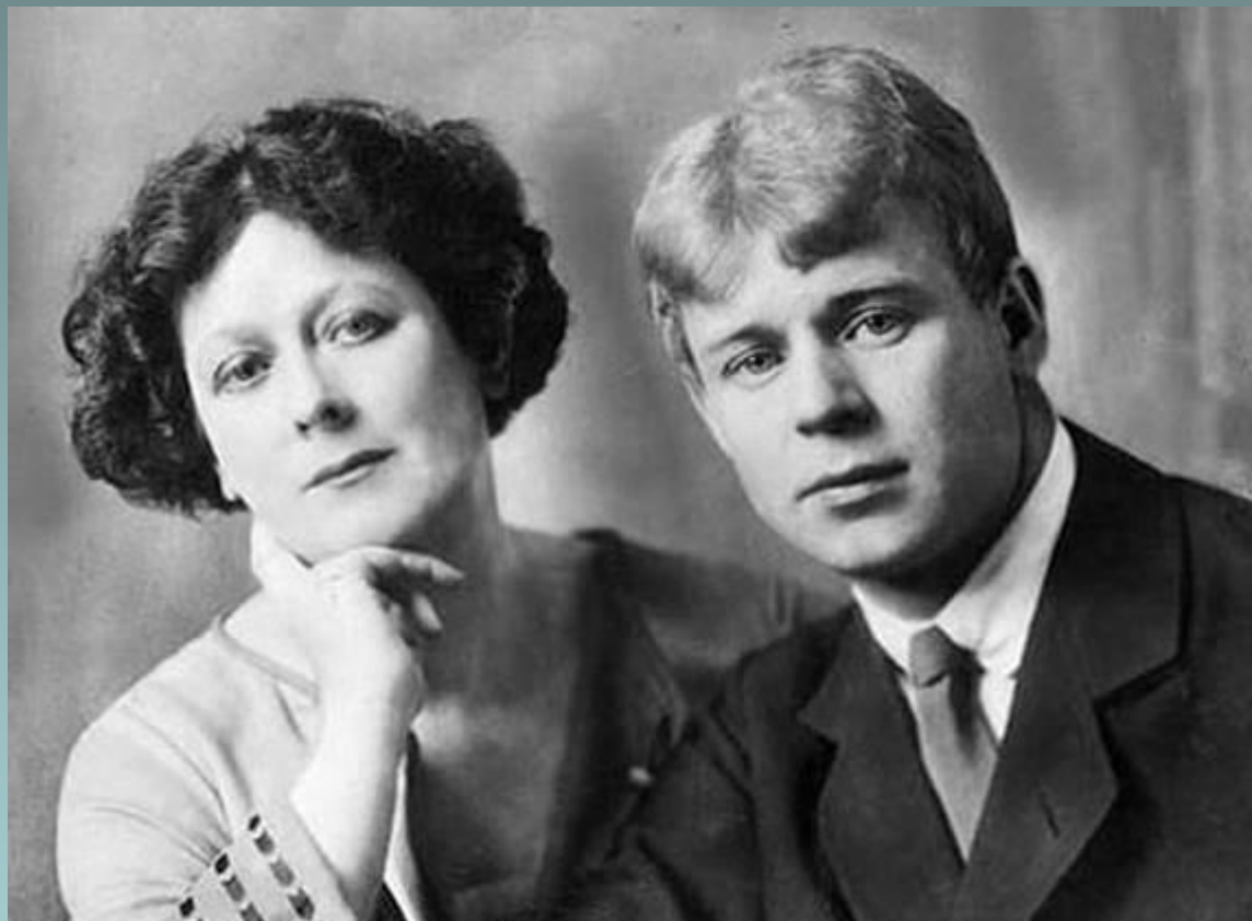
Сергей Есенин и Айседора Дункан 1923 г.