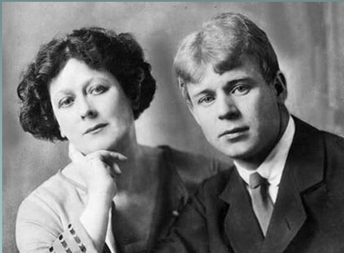
Сергей Есенин и Айседора Дункан 1923 г.