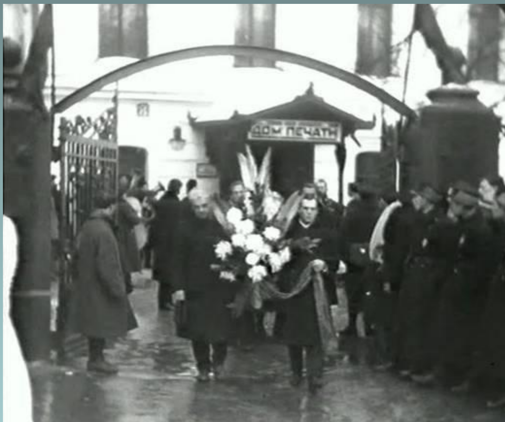
Похороны Сергея Есенина