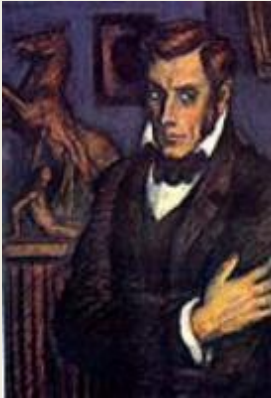
Иллюстрация к роману Гончарова