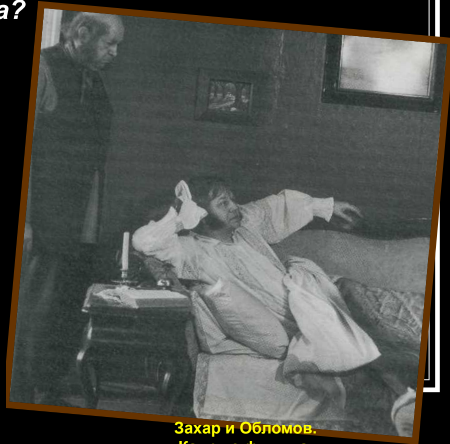
Захар и Обломов. Кадр из фильма.

4. Гончаров – мастер художественных деталей. Можно ли сказать, что художественная деталь обогащает образ Обломова, помогая понять главные черты?