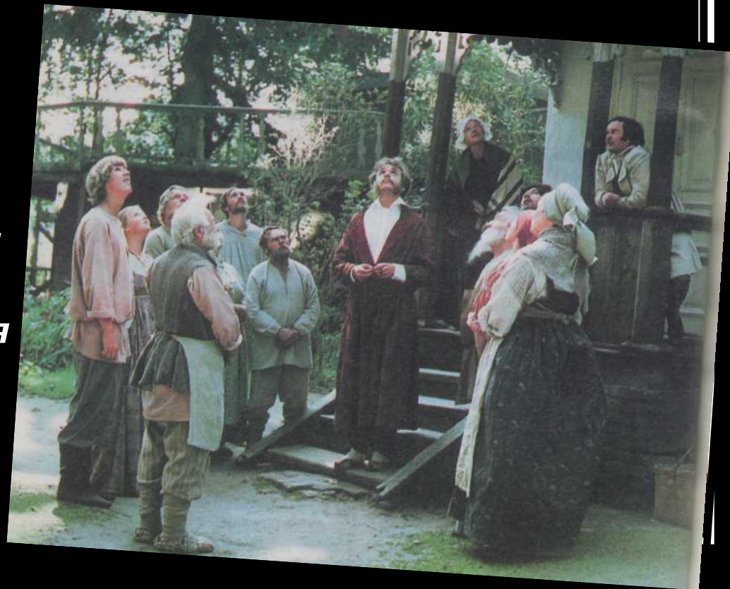
Кадр из фильма «Несколько дней из жизни И. И. Обломова»

4. Почему Обломов любит крапивой, рябиной у дома Пшеницыной, предпочитает тихую, спокойную местность и деревенский быт?