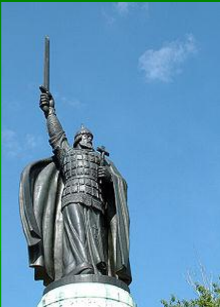
Памятник Илье Муромцу в г. Муроме