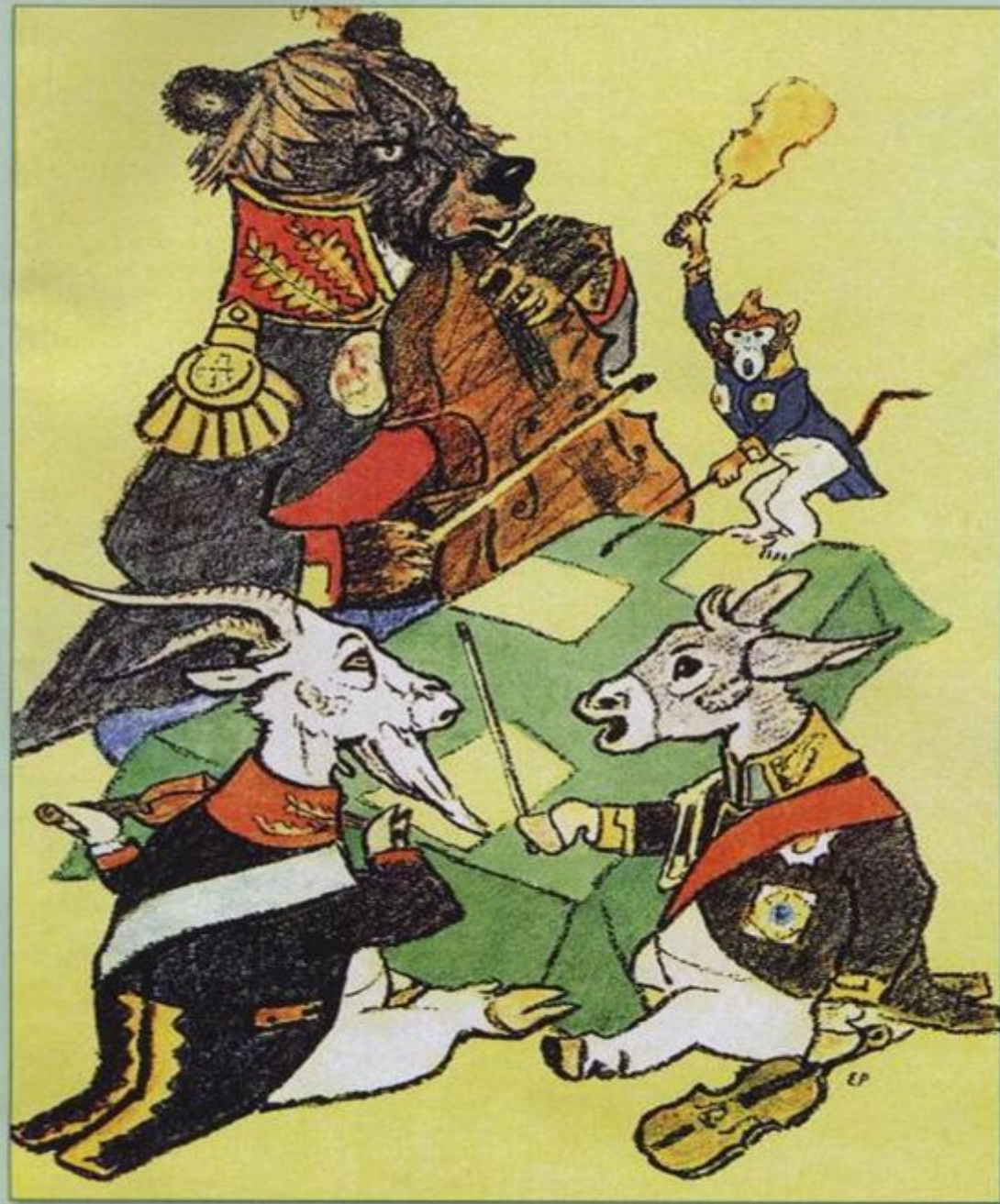
Е. Рачев. Иллюстрация к басне «Квартет»

«А вы, друзья, как ни садитесь, Всё в музыканты не годитесь».