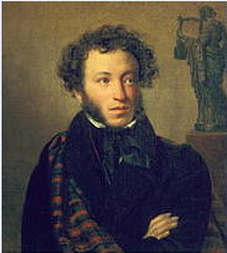
А. С. Пушкин. Портрет работы О. А. Кипренского (1827.)

При всем своеобразии пушкинской трактовки она восстанавливает некоторые детали как пьесы Тирсо де Молины — заглавие и выходящий на первый план мотив расплаты, так и античного мифа о мстящей статуе. То, что нередко воспринималось как особая дерзость и рискованность пушкинского замысла, свидетельство особой безнравственности его героя, — приглашение Дон Гуаном Командора, превращенного Пушкиным из отца в мужа Доны Анны, позволило ввести в пьесу мотив мести из ревности, коль скоро статуя разъединяет влюбленных. Мотив мстящей статуи, разлучающей влюбленных в «Каменном госте», оказывается особенно выразительным в связи с тем, что при расплате присутствует именно Дона Анна, а не слуга Лепорелло (как у Моцарта) или Сганарель (как у Мольера).