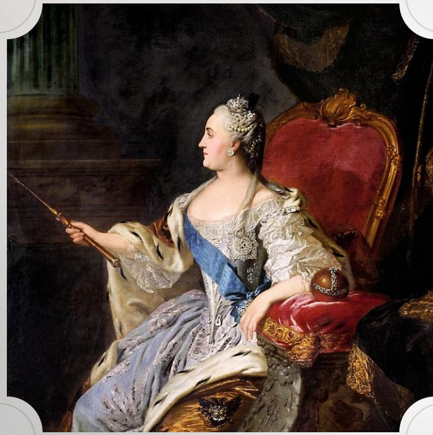
Ф. С. Рокотов. Портрет Екатерины II. 1763 г

В своей оде «Фелица» Г. Р. Державин создает образ идеального правителя. Подобно императрице Екатерине II, идеальный правитель должен быть добродетельным, справедливым и рассудительным. Державин изображал и бытовую жизнь императрицы, сказав новое слово в русской литературе.