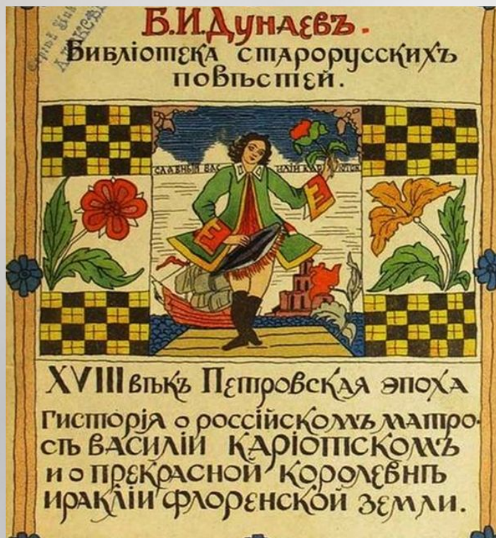
Лубочное издание «Истории». 1914 год.

Причиной повсеместного уважения к российскому матросу и его феерических достижений становятся его личные достоинства — ум, образованность и инициатива, те самые качества, которые именно в Петровскую эпоху начали позволять рядовым гражданам выдвигаться на авансцену русской общественной жизни (Инициатива; Ум; Образованность; Предприимчивость; Смелость; Благовоспитанность; Романтичность).