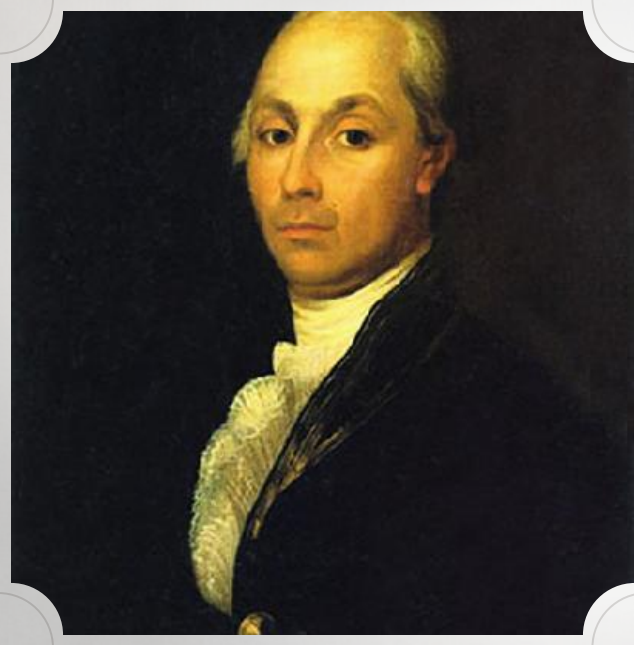
Портрет А.Н. Радищева Неизвестный художник. Не позднее 1790

В своем произведении «Путешествие из Петербурга в Москву» А. Н. Радищев создает образ рефлексирующего, сопереживающего и бунтующего человека. Его герой борется за свои права и права ущемленных граждан, не боится критиковать власть и постоянно размышляет о настоящем и будущем своего отечества.