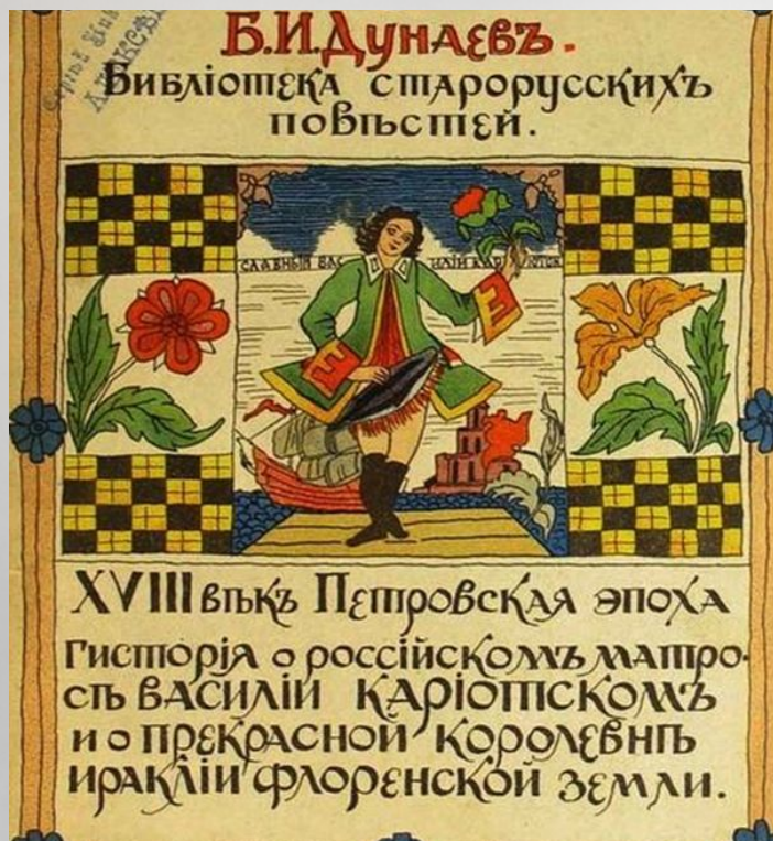
Лубочное издание «Истории». 1914 год.

Причиной повсеместного уважения к российскому матросу и его феерических достижений становятся его личные достоинства — ум, образованность и инициатива, те самые качества, которые именно в Петровскую эпоху начали позволять рядовым гражданам выдвигаться на авансцену русской общественной жизни (Инициатива; Ум; Образованность; Предприимчивость; Смелость; Благовоспитанность; Романтичность).