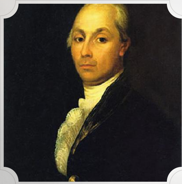
Портрет А.Н. Радищева Неизвестный художник. Не позднее 1790

В своем произведении «Путешествие из Петербурга в Москву» А. Н. Радищев создает образ рефлексирующего, сопереживающего и бунтующего человека. Его герой борется за свои права и права ущемленных граждан, не боится критиковать власть и постоянно размышляет о настоящем и будущем своего отечества.