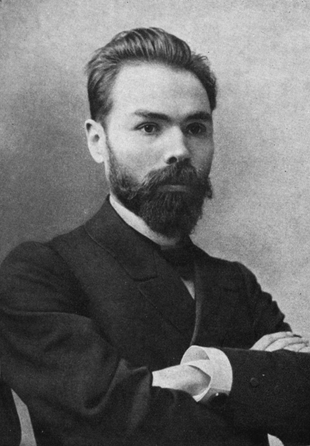
Валерий Яковлевич Брюсов (1873 - 1924)