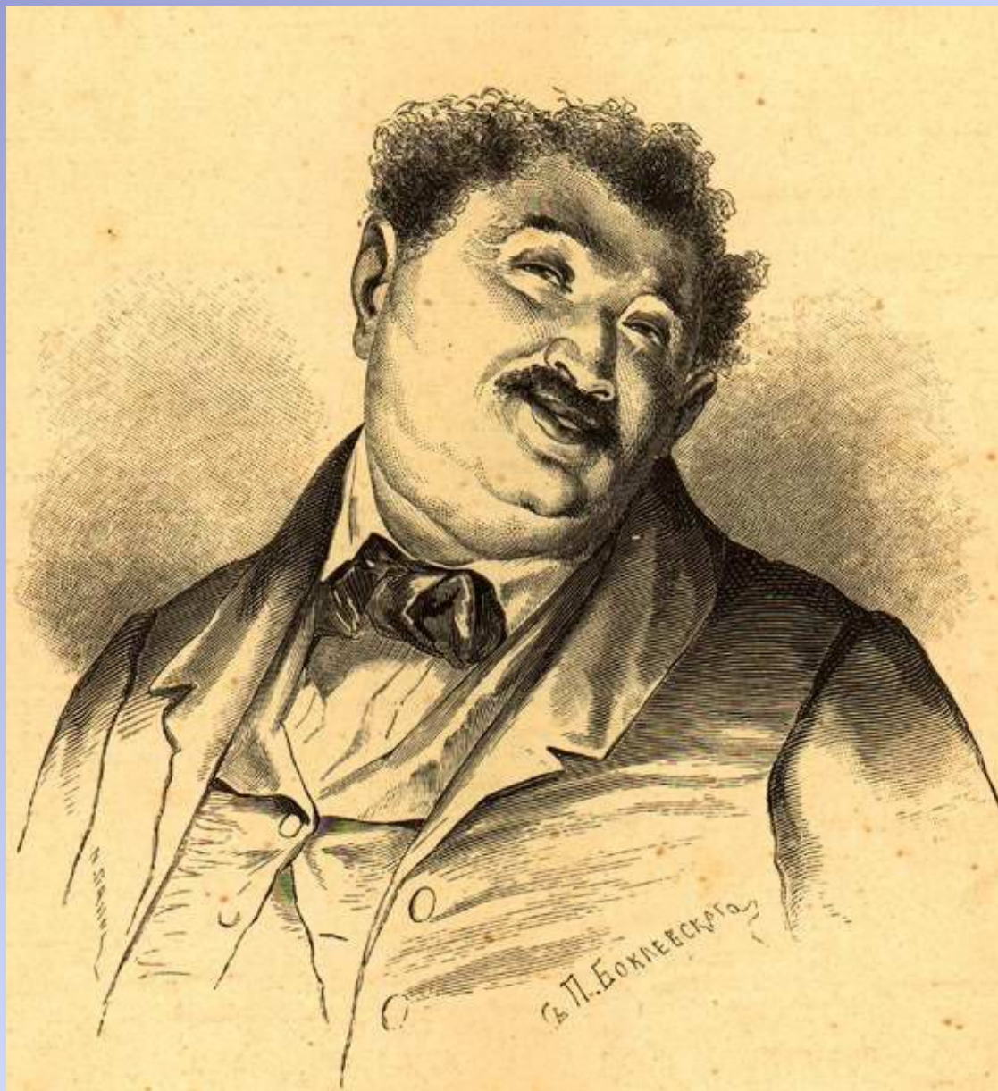
Манилов. Художник П. Боклевский