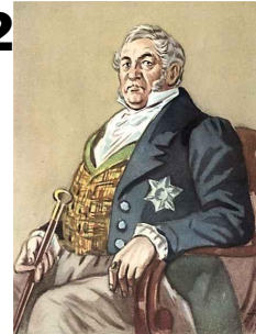
2) Александр Чацкий