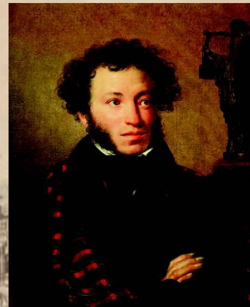
А.С. Пушкин «Евгений Онегин»