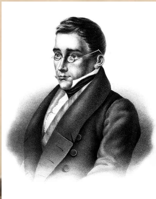
А.С. Грибоедов «Горе от ума»