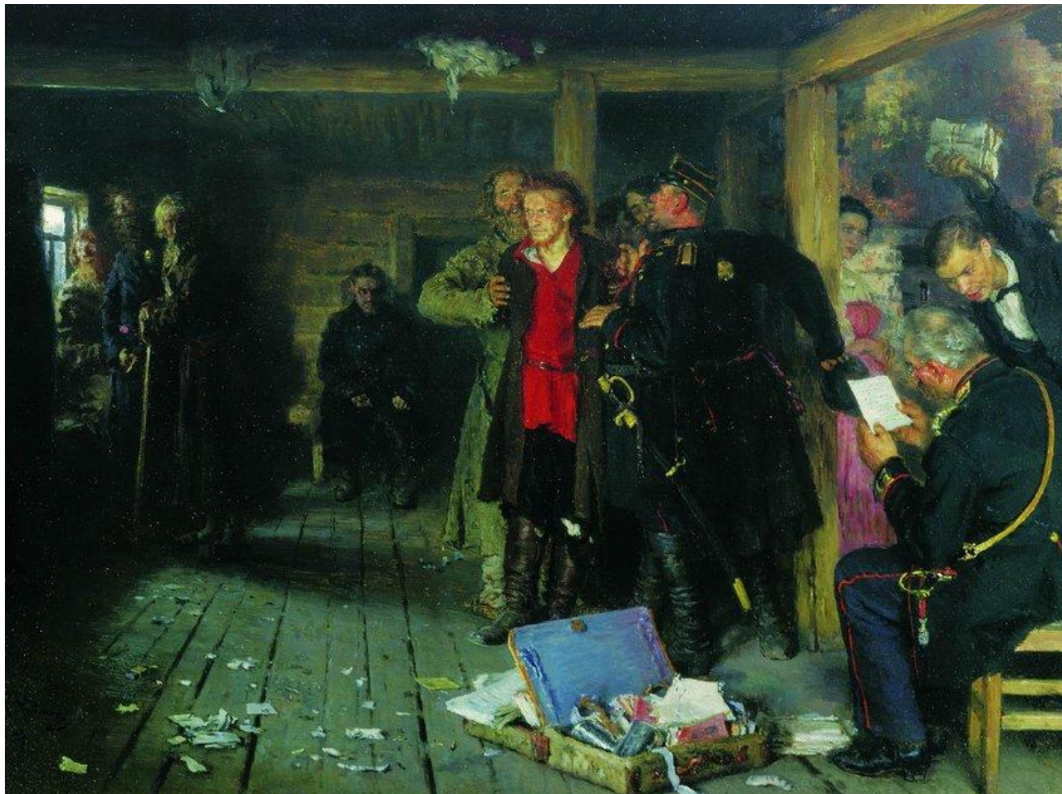
Илья Репин Арест пропагандиста