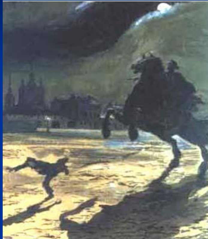
BENUA "MEDNIJ VSADNIK"

В 1833 году в Болдине Пушкин написал поэму «Медный всадник», одно из самых загадочных произведений русской литературы. В ней поэт по-новому решает тему Петербурга, по-новому выбирает героя и строит конфликт.