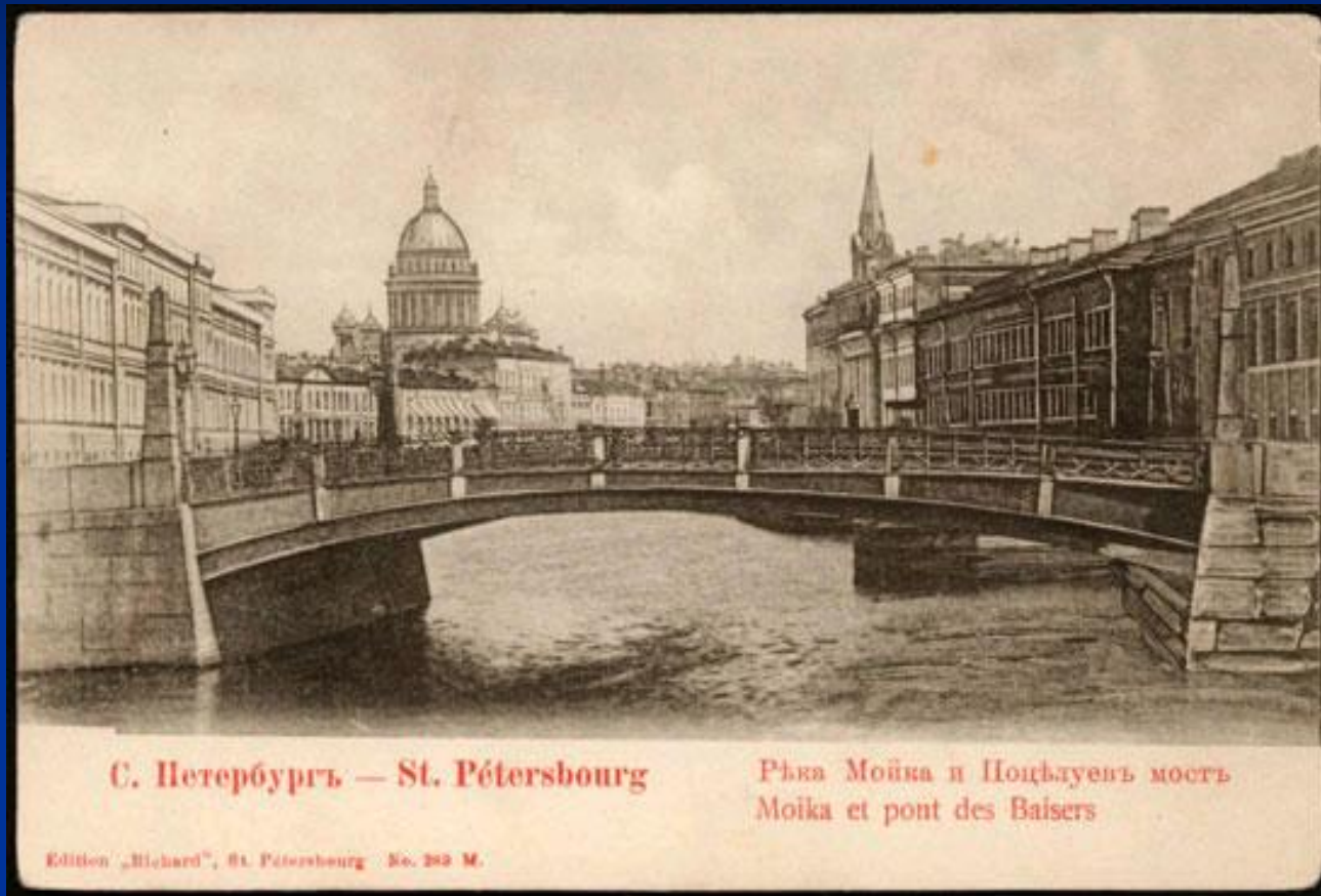
С. Петербургъ — St. Pétersbourg

К теме Петербурга обращались многие поэты и писатели. В русской литературе, да и в сознании общества в целом, Петербург с момента своего возникновения воспринимался не только как конкретный город, как новая столица, но и как символ новой России, символ ее будущего.