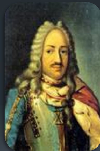
Лефорт Франц Яковлевич

Во время правления Петра I была организована дипломатическая миссия России в Западную Европу в 1697—1698 годах, которую возглавлял Лефорт и которая называлась «Великое посольство».