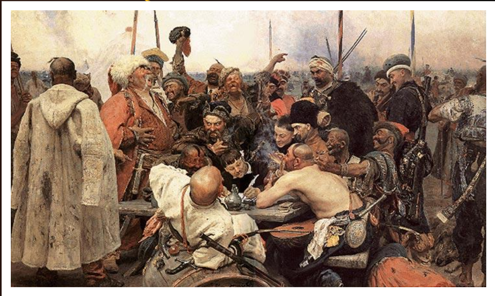
Репин «Запорожцы пишут письмо турецкому султану»