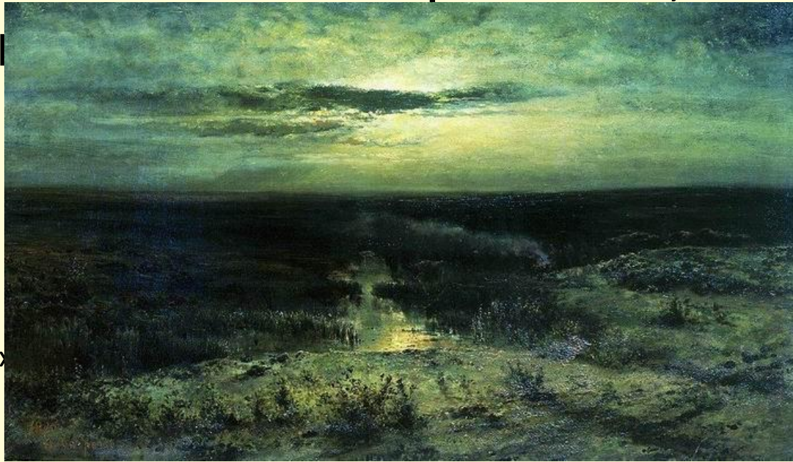
А. Саврасов «Лунная ночь»

Стихи Фета окружены сиянием. Чехов называл их "пленительными", Салтыков-Щедрин - "самыми искренними, свежими