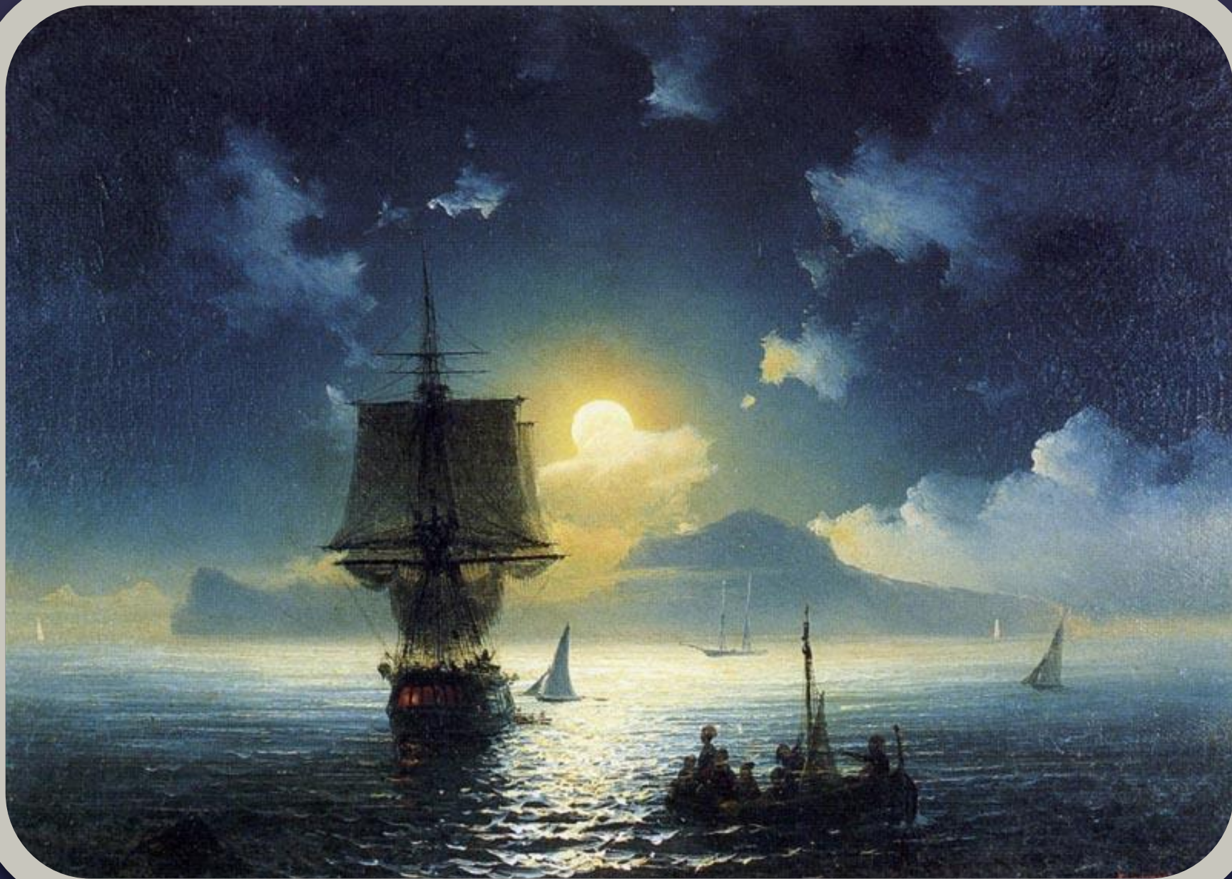
Лунная ночь на Капри.