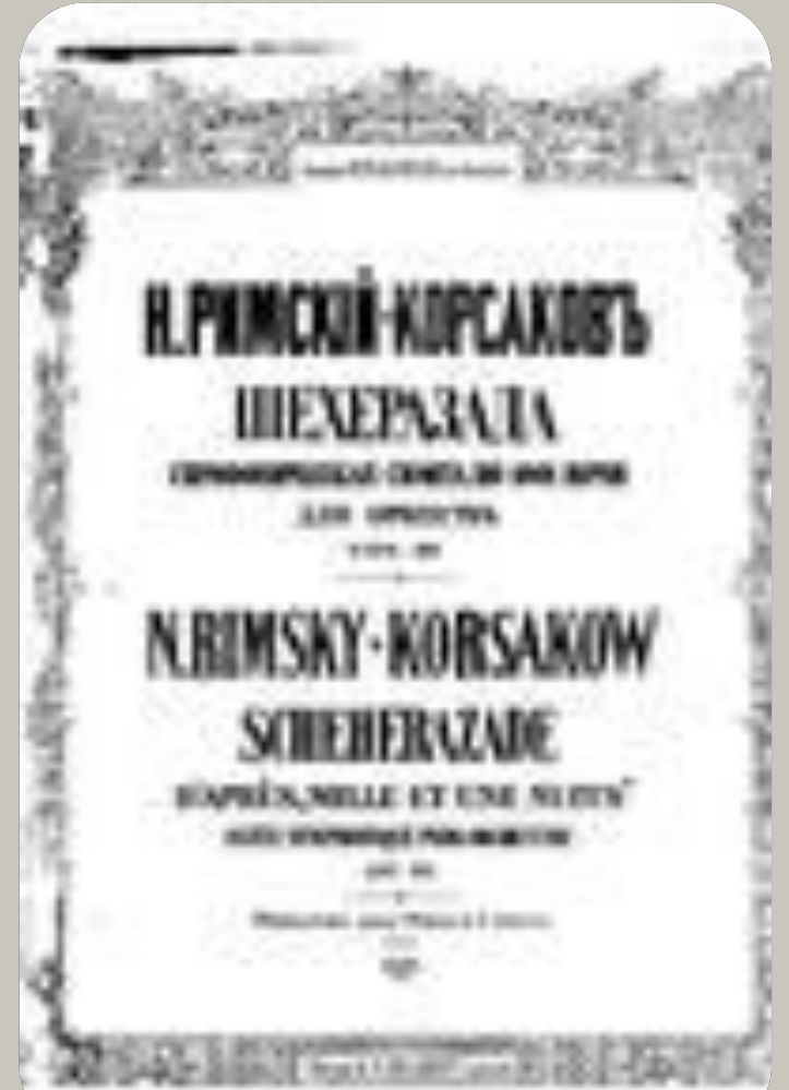
Николай Андреевич Римский-Корсаков