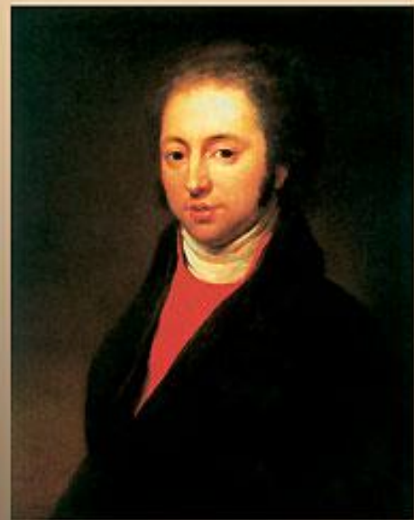
Родители Ф. И. Тютчева