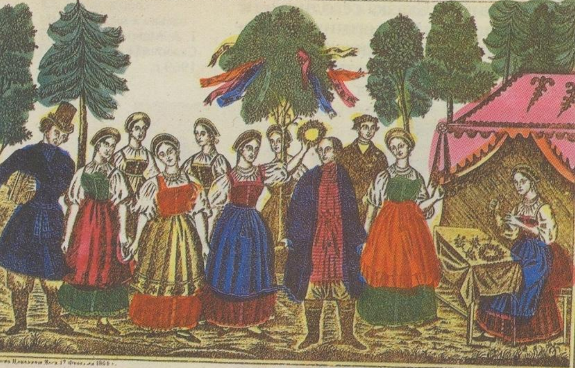
Иллюстрация к статье 17 от 17 июля 1866 г.