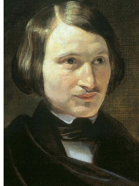
Гоголь Николай Васильевич (1809-1852)

Наряду с поэзией начала развиваться проза. Прозаики начала века находились под влиянием английских исторических романов В. Скотта, переводы которых пользовались огромной популярностью. Развитие русской прозы 19 века началось с прозаических произведений А.С. Пушкина и Н.В. Гоголя. Пушкин под влиянием английских исторических романов создает повесть «Капитанская дочка», где действия разворачивается на фоне грандиозных исторических событий во времена Пугачевского бунта*.