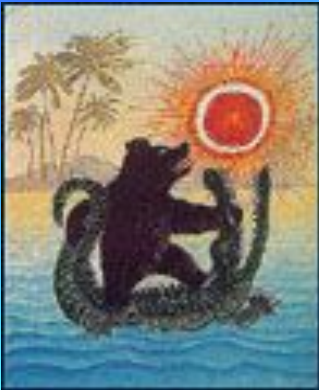
Иллюстрация Ю. Васнецова к сказке К.И. Чуковского «Краденое солнце»