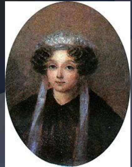
Мария Ивановна Гоголь-Яновская , мать писателя