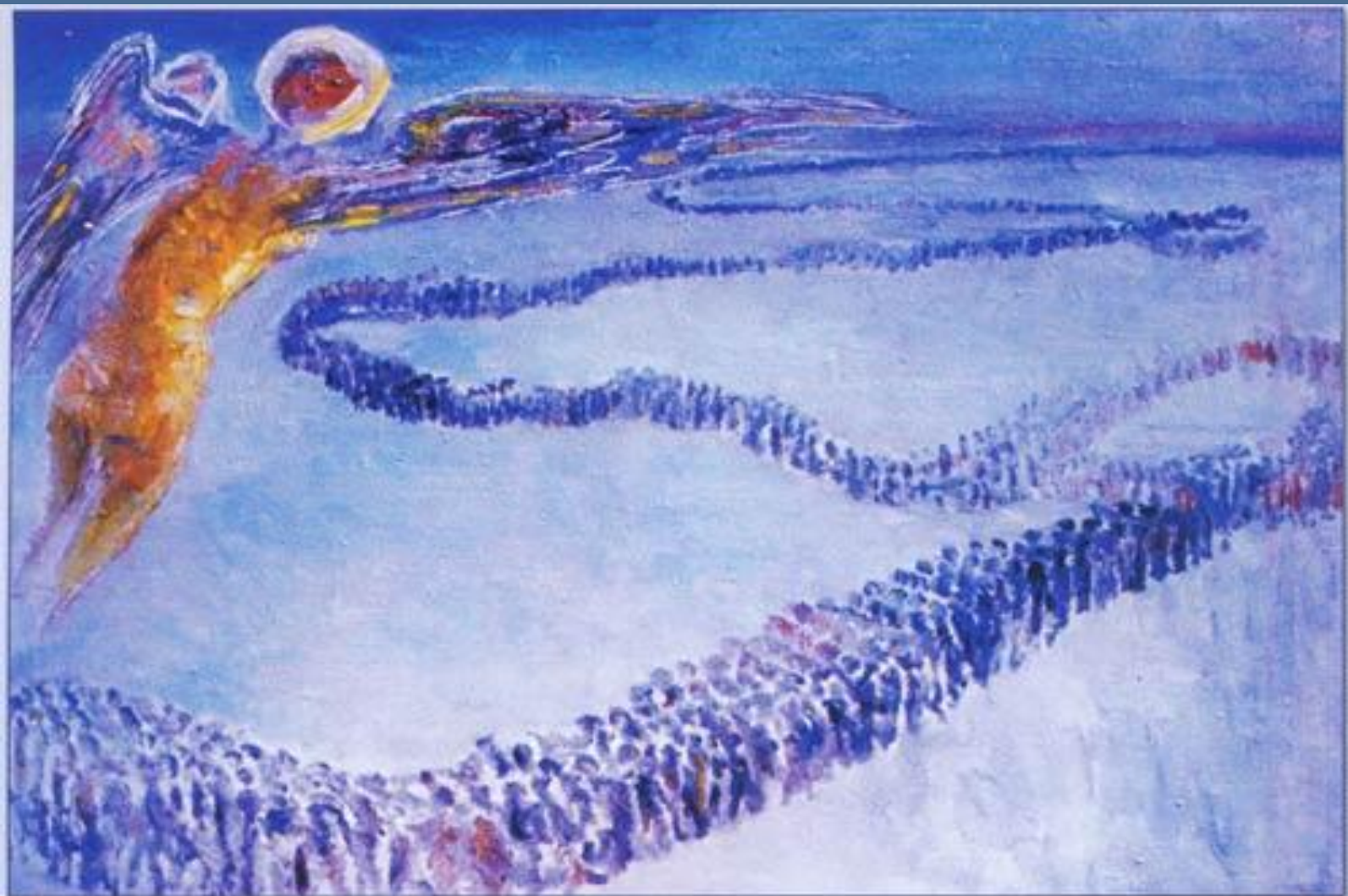
Р.Веденеев. Ангел этапа. 2007