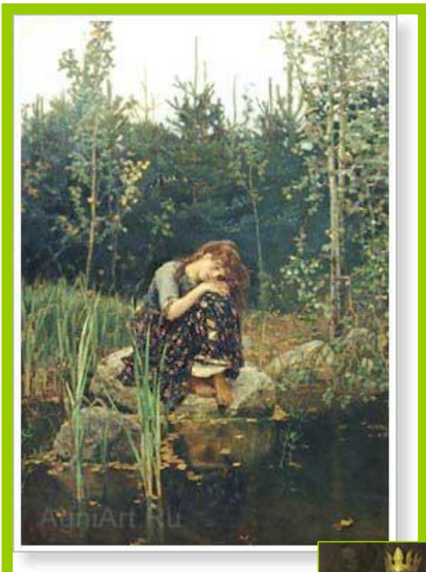
Картина «Алёнушка». В. Васнецов.