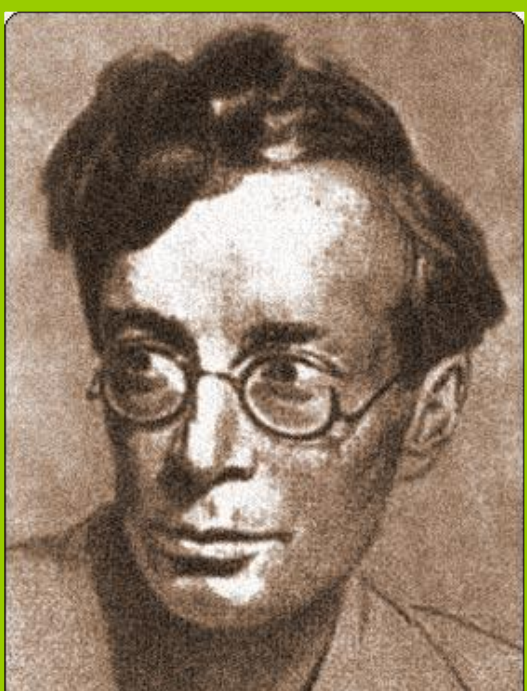
Дмитрий Борисович Кедрин (1907-1945)