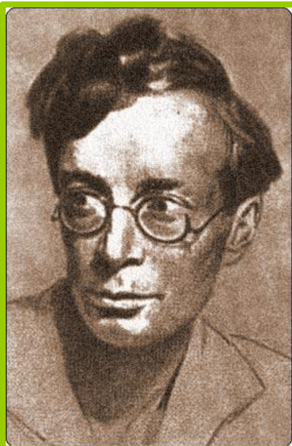
Дмитрий Борисович Кедрин (1907-1945)