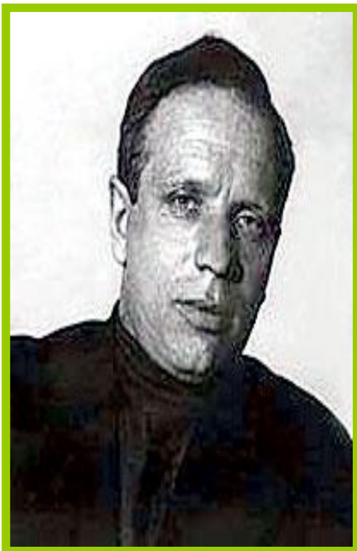
А. А. Прокофьев (1900-1971)