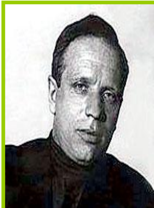
Александр Андреевич Прокофьев (1900-1971)