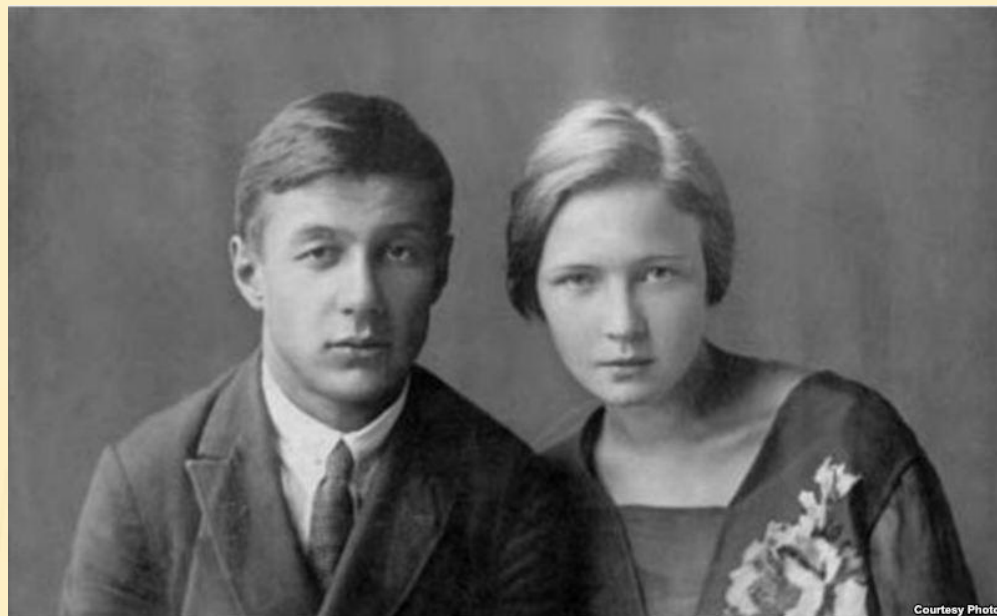
Ольга Берггольц и Борис Корнилов