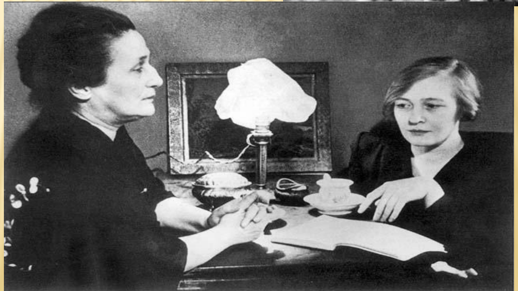
Ольга Берггольц и Анна Ахматова