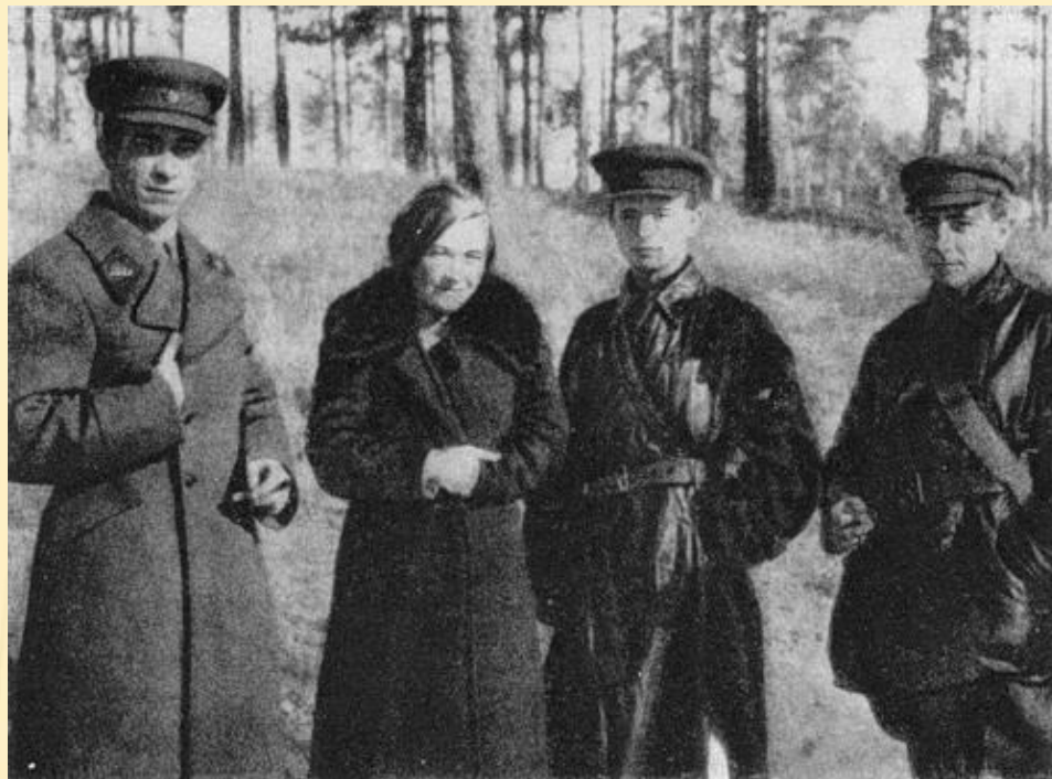
Ольга Берггольц на Ленинградском фронте 1942 год

Ольгу Берггольц была направлена в распоряжение литературно-драматической редакции ленинградского радио. Спустя самое недолгое время тихий голос Ольги Берггольц стал голосом долгожданного друга в застывших и темных блокадных ленинградских домах, стал голосом самого Ленинграда. Это превращение показалось едва ли не чудом: из автора мало кому известных детских книжек и стихов, про которые говорилось "это мило, славно, приятно - не больше", Ольга Берггольц в одночасье вдруг стала поэтом, олицетворяющим стойкость Ленинграда." (Сборник "Вспоминая Ольгу Берггольц"). В Доме Радио она работала все дни блокады, почти ежедневно ведя радиопередачи, позднее вошедшие в ее книгу "Говорит Ленинград". Ольга Берггольц была награждена орденом