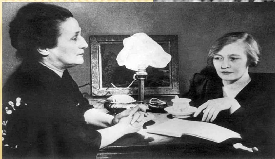
Ольга Берггольц и Анна Ахматова