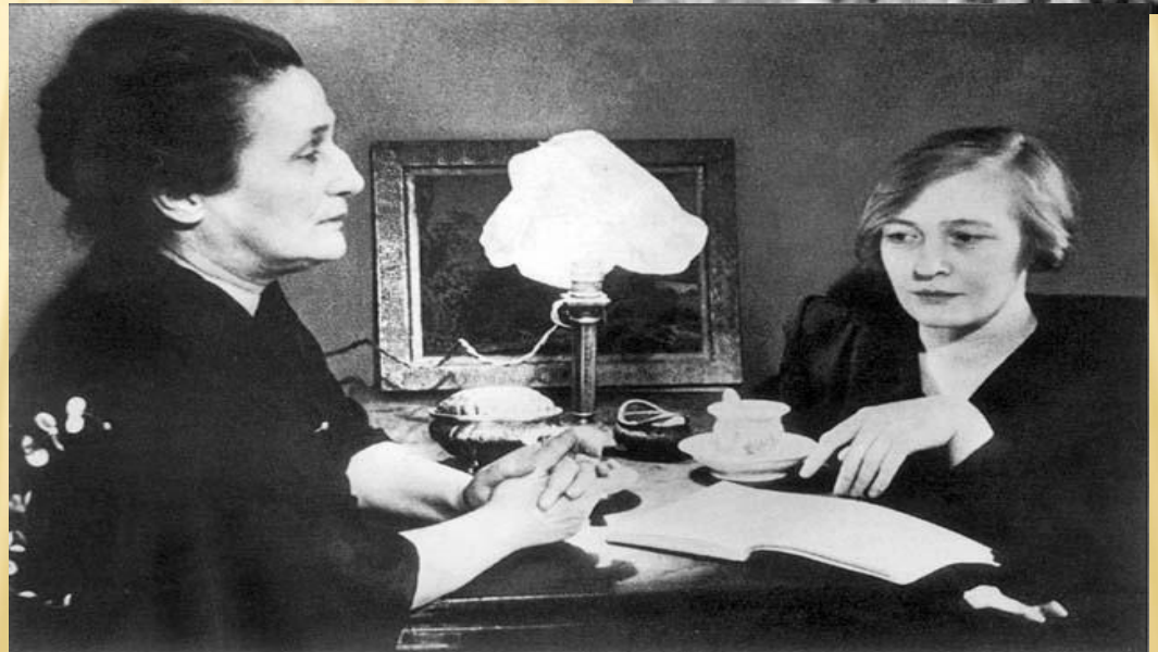
Ольга Берггольц и Анна Ахматова