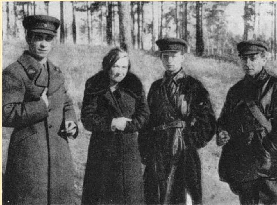
Ольга Берггольц на Ленинградском фронте 1942 год

Ольгу Берггольц была направлена в распоряжение литературно-драматической редакции ленинградского радио. Спустя самое недолгое время тихий голос Ольги Берггольц стал голосом долгожданного друга в застывших и темных блокадных ленинградских домах, стал голосом самого Ленинграда. Это превращение показалось едва ли не чудом: из автора мало кому известных детских книжек и стихов, про которые говорилось "это мило, славно, приятно - не больше", Ольга Берггольц распоряжение литературно-драматической редакции ленинградского радио. Спустя самое недолгое время тихий голос Ольги Берггольц стал голосом долгожданного друга в застывших и темных блокадных ленинградских домах, стал голосом самого Ленинграда. Это превращение