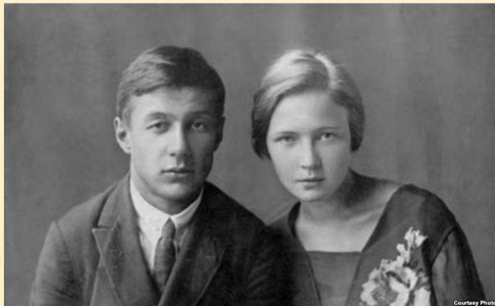
Ольга Берггольц и Борис Корнилов