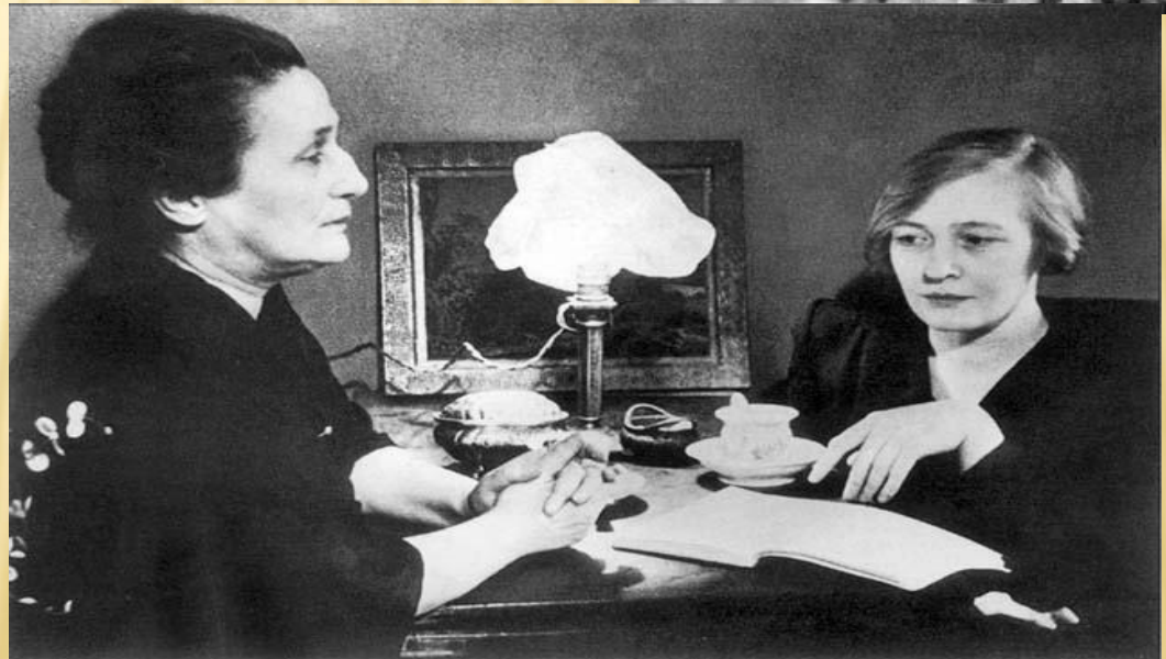
Ольга Берггольц и Анна Ахматова