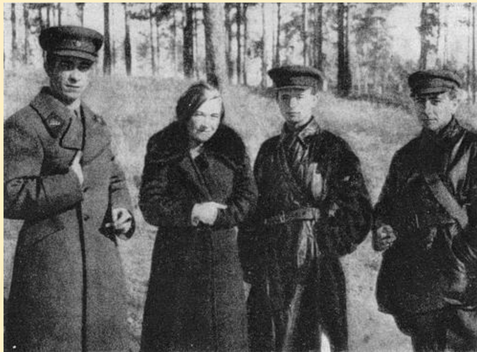
Ольга Берггольц на Ленинградском фронте 1942 год

Ольгу Берггольц была направлена в распоряжение литературно-драматической редакции ленинградского радио. Спустя самое недолгое время тихий голос Ольги Берггольц стал голосом долгожданного друга в застывших и темных блокадных ленинградских домах, стал голосом самого Ленинграда. Это превращение показалось едва ли не чудом: из автора мало кому известных детских книжек и стихов, про которые говорилось "это мило, славно, приятно - не больше", Ольга Берггольц распоряжение литературно-драматической редакции ленинградского радио. Спустя самое недолгое время тихий голос Ольги Берггольц стал голосом долгожданного друга в застывших и темных блокадных ленинградских домах, стал голосом самого Ленинграда. Это превращение